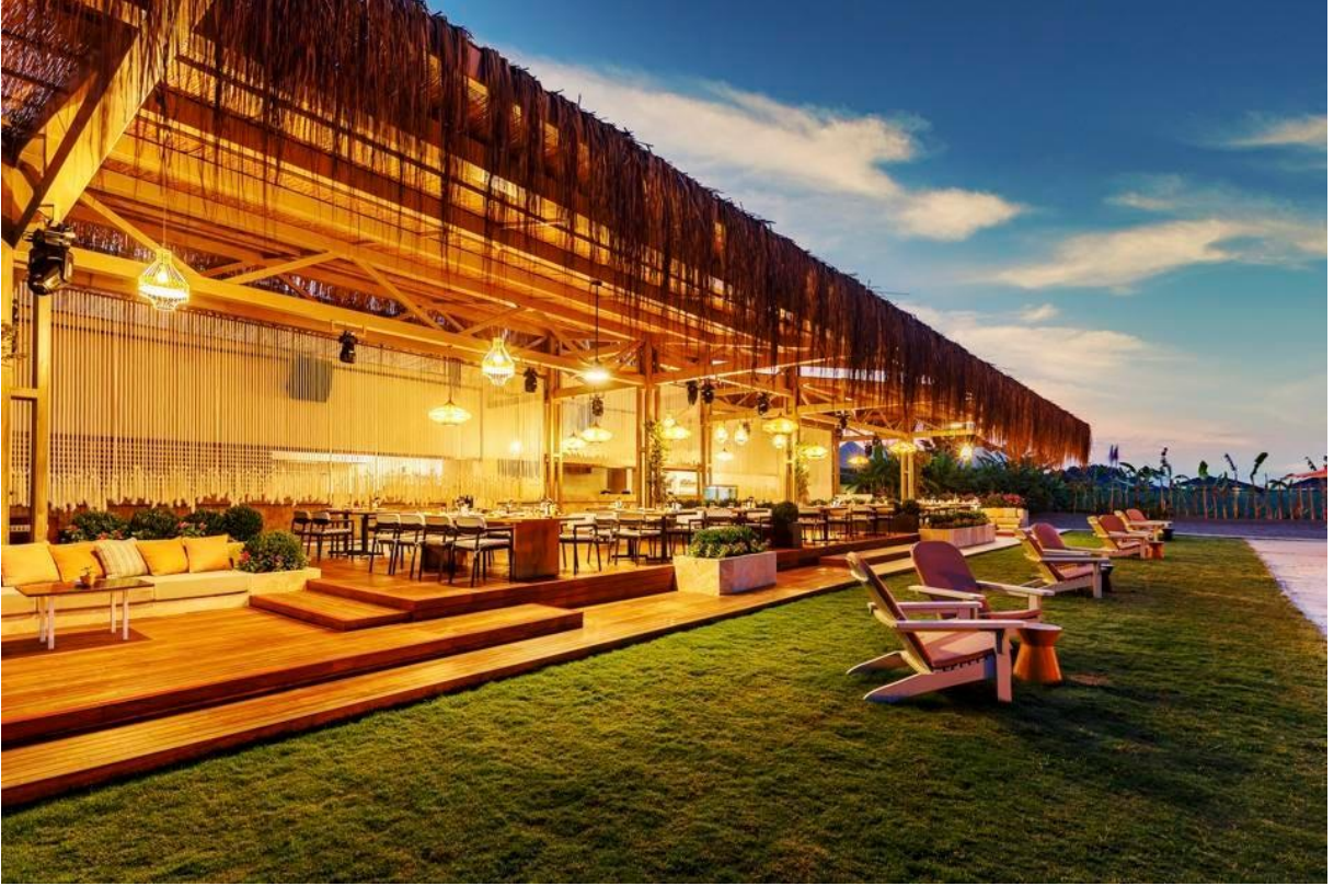
Palazzo Lounge

Türkiye'ye giden ziyaretçiler aynı zamanda Türk Havayolları'nın 'İstanbul Stopover Hizmeti'nden yararlanmayı unutmamalı. Tarihi zenginliklerle, olağanüstü yemeklerle dolu ve iki kıtayı birleştiren İstanbul'u ziyaret etme fırsatı bulunduğu değerlendirilmeli ve Türk Havayolları, uzun duraklama yapacak olan Business Class yolcularına, havaalanında uçuş değiştirmek yerine ücretsiz olarak 5 yıldızlı bir otelde üç gece konaklama sunmaktadır. Ekonomi sınıfı da dışlanmıyor tabii, onlar da 4 yıldızlı bir otelde iki gece konaklayabiliyorlar. Konaklama için zamanınız bulunmaması durumunda uzun duraklamayı da seçebilirsiniz. Havayolunun, altı saat veya daha uzun duraklamalarda ücretsiz olan Touristanbul programı tarihi yerlere günübirlik tur, İstanbul mutfağını tatma fırsatı ve havaalanına gidiş geliş ulaşım sağlamaktadır.