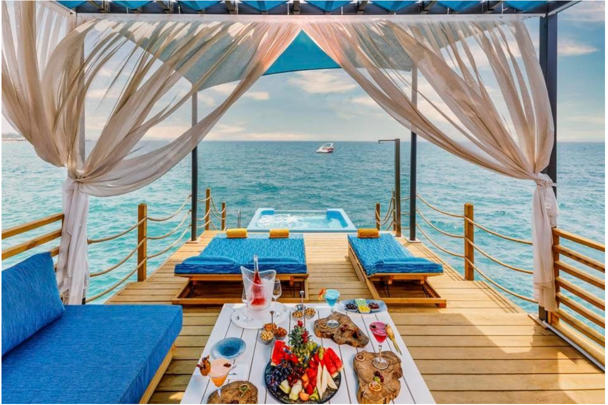
Kaya Palazzo Belek'te Cabana

Güneybatı Türkiye'nin Akdeniz kıyı şeridi uzun zamandır tam bir tatil cenneti oldu. Kumsal ve lüksün buluşması ile uluslararası seyahat kulağa cazip geliyorsa, bir sonraki yolculuğunuzu Kaya Palazzo Golf Resort Belek istikametine doğru planlamaya başlayın.