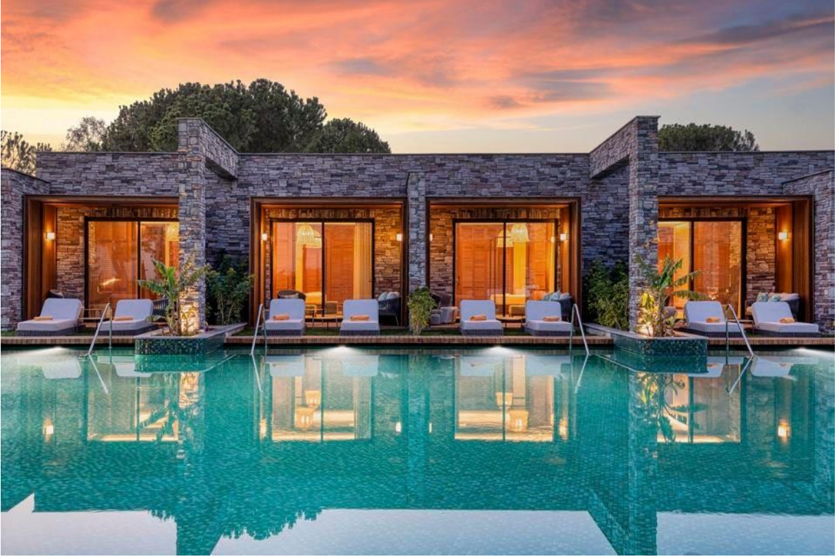
Lagoon Suite - Kaya Palazzo Belek ONURKURU PHOTOGRAPHY

Lagoon Suite misafirlerinin gün boyunca yemek yemek için Lagoon Restoranı bulunmakta olup, Mansions misafirleri de Golf Club Restoranına gidebilirler. Ana binada gidilebilecek dört adet a la carte restoran bulunmakta: Türk mutfağı için Develi; İtalyan yemekleri için Serafina; Asya'dan ilham alan mutfağıyla Yada Sushi ve Palazzo Steak House (karnınız kurt gibi acıktığında gitmeniz için).