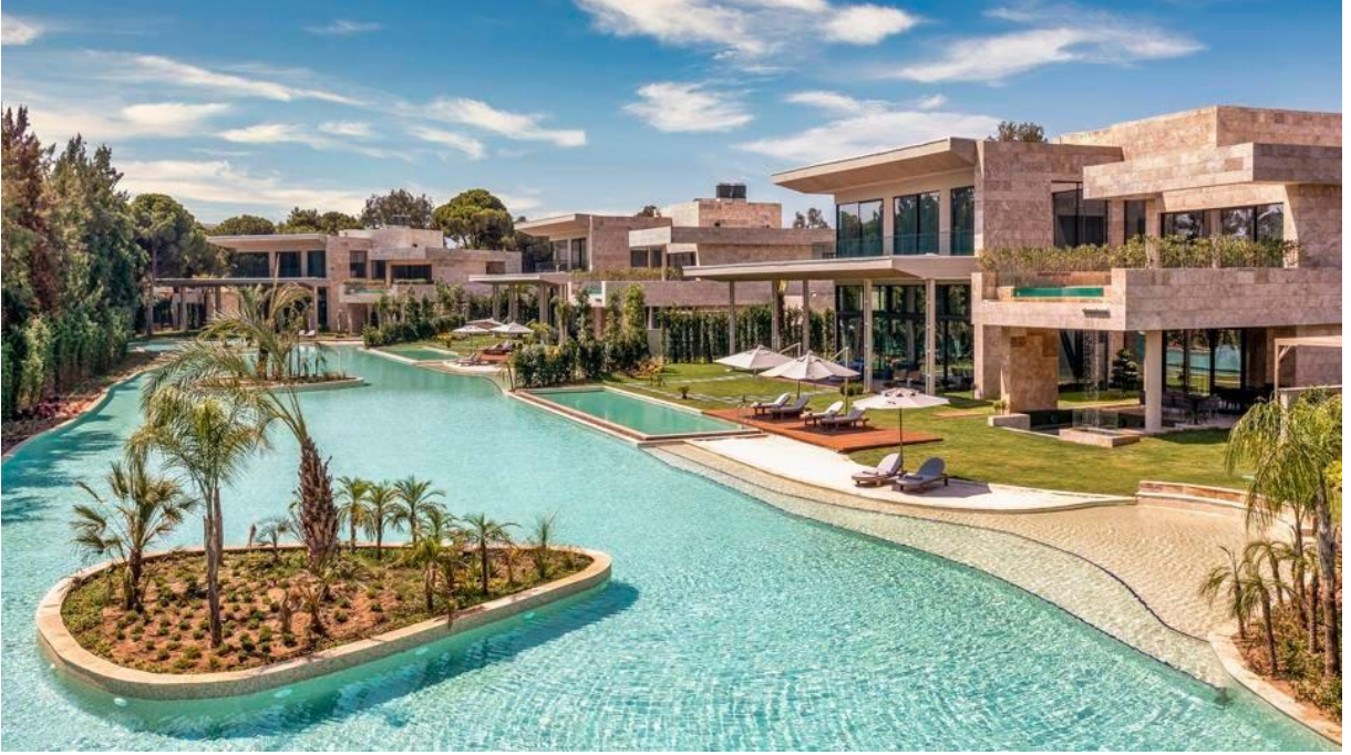
Mansions - Kaya Palazzo Belek KAYA PALAZZO

avlusuna çıkan ve daha sonra 'lagoon' basamaklarından inerek sitler boyu uzanan ısıtmalı havuza gidebilirsiniz.