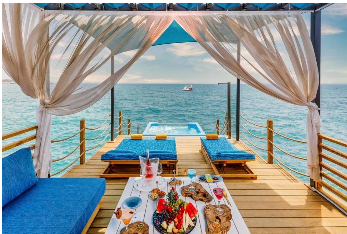
Kaya Palazzo Belek Cabana

Средиземноморское побережье юго-западной Турции уже давно стало раем для отдыха, и если сочетание пляжа и роскоши с небольшим добавлением международных путешествий звучит для вас привлекательно, начните планировать свою следующую поездку в Kaya Palazzo Golf Resort Белек.