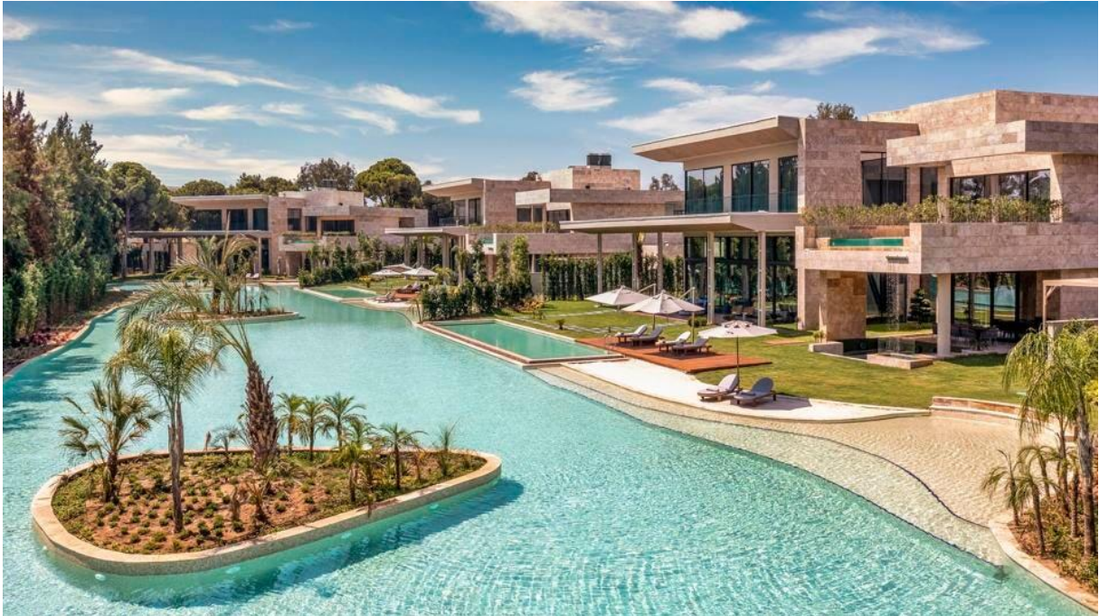
Mansions - Kaya Palazzo Belek KAYA PALAZZO

den Innenhof Ihres eigenen Sonnendecks führt, und dann die Stufen der ‚Lagune‘ hinunter zu den Suiten.