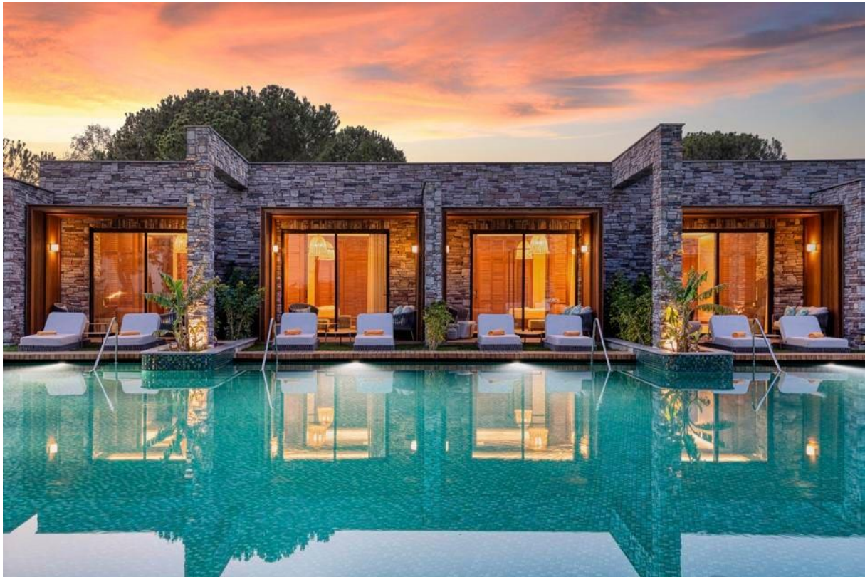
Lagoon Suite - Kaya Palazzo Belek

Für das ganztägige Essen steht den Gästen der Lagunen-Suite ein eigenes Lagunen-Restaurant zur Verfügung, während die Gäste der Villa das Golf Club Restaurant aufsuchen können. Im Hauptgebäude der Anlage gibt es vier Spezialitätenrestaurants: Develi für türkische Küche; Serafina für italienische Küche; Yada Sushi mit seiner asiatisch inspirierten Küche und Palazzo Steak House (für den kleinen Hunger zwischendurch).