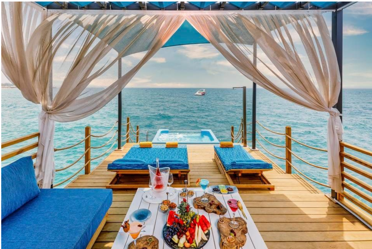
Kaya Palazzo Belek Cabana

Die Mittelmeerküste im Südwesten der Türkei ist seit langem ein Urlaubsparadies - und wenn eine Kombination aus Strand und Luxus mit ein wenig internationalem Reisen verlockend klingt, sollten Sie Ihre nächste Reise ins Kaya Palazzo Golf Resort Belek planen.