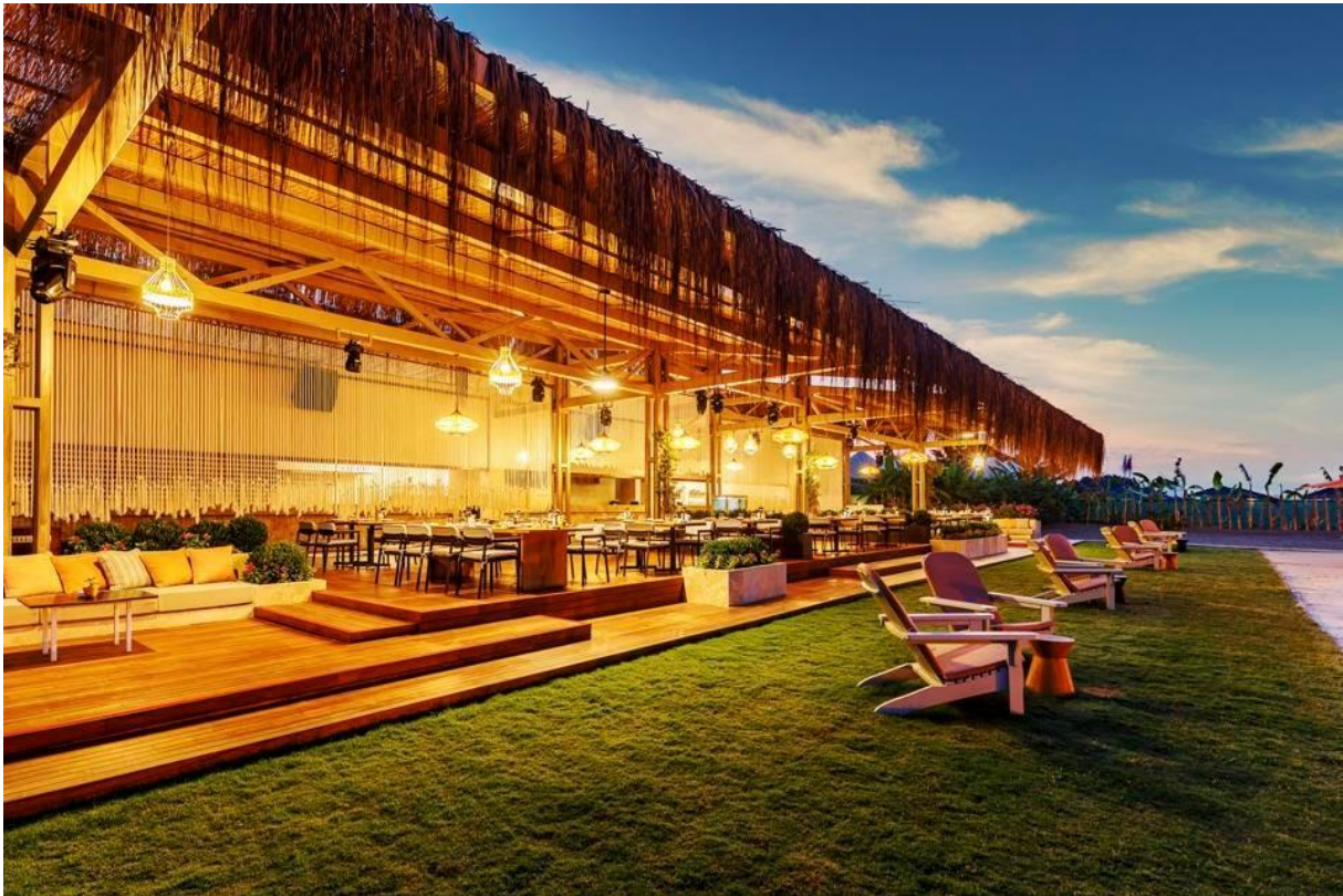
Palazzo Lounge

Besucher, die in die Türkei reisen, sollten auch daran denken, den „Istanbul Stopover Service“ der Turkish Airlines zu nutzen. Die Gelegenheit, Istanbul zu besuchen, eine Stadt voller historischer Reichtümer, außergewöhnlichem Essen und der Verbindung zweier Kontinente, sollte man nutzen, wenn sie sich bietet. Turkish Airlines bietet Passagieren der Business Class mit langen Zwischenlandungen drei kostenlose Übernachtungen in einem 5-Sterne-Hotel an, anstatt am Flughafen umzusteigen. Aber auch die Economy Class ist nicht ausgeschlossen, sie können zwei Nächte in einem 4-Sterne-Hotel verbringen. Und wenn Sie keine Zeit für einen kompletten Aufenthalt haben, können Sie auch einen längeren Zwischenstopp einlegen. Das Touristanbul-Programm der Fluggesellschaft, das ab einer Aufenthaltsdauer von sechs Stunden kostenlos ist, bietet eine Tagestour zu historischen Stätten, die Möglichkeit, die Istanbuler Küche zu probieren, sowie den Transport zum und vom Flughafen.